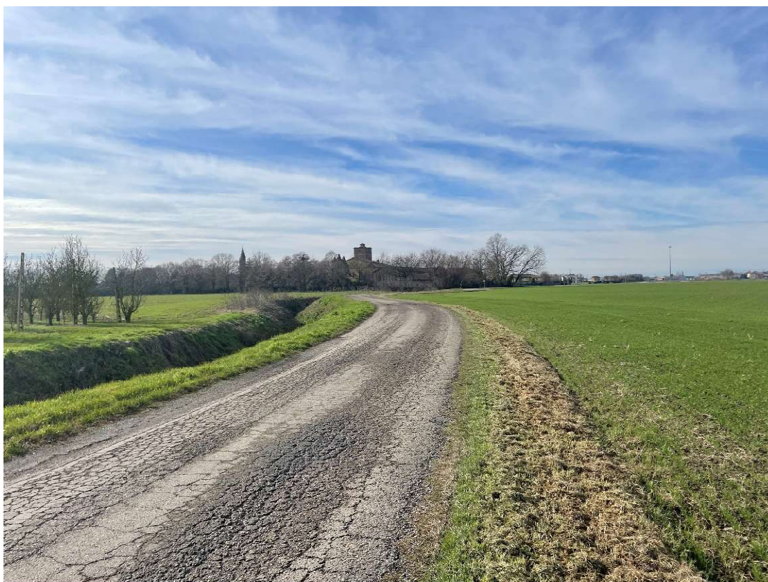
Foto 10 – Panoramica del lotto vista da Via Fontana in direzione Ovest