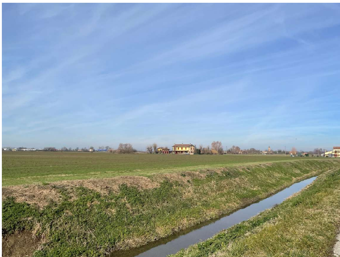
Foto 18 – Panoramica del lotto e del canale visti da Via Raveda in direzione Nord-Ovest