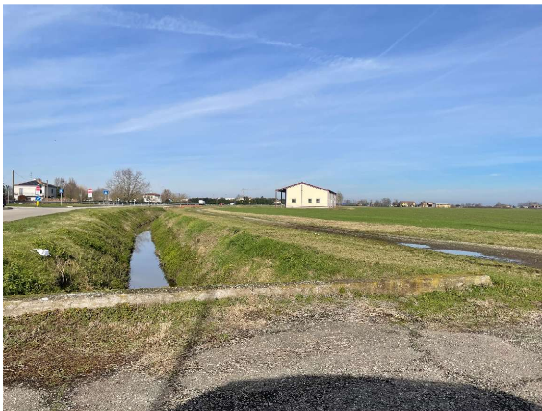
Foto 12 – Panoramica del canale all'altezza dell'incrocio tra via Fontana e Via Rubizzano