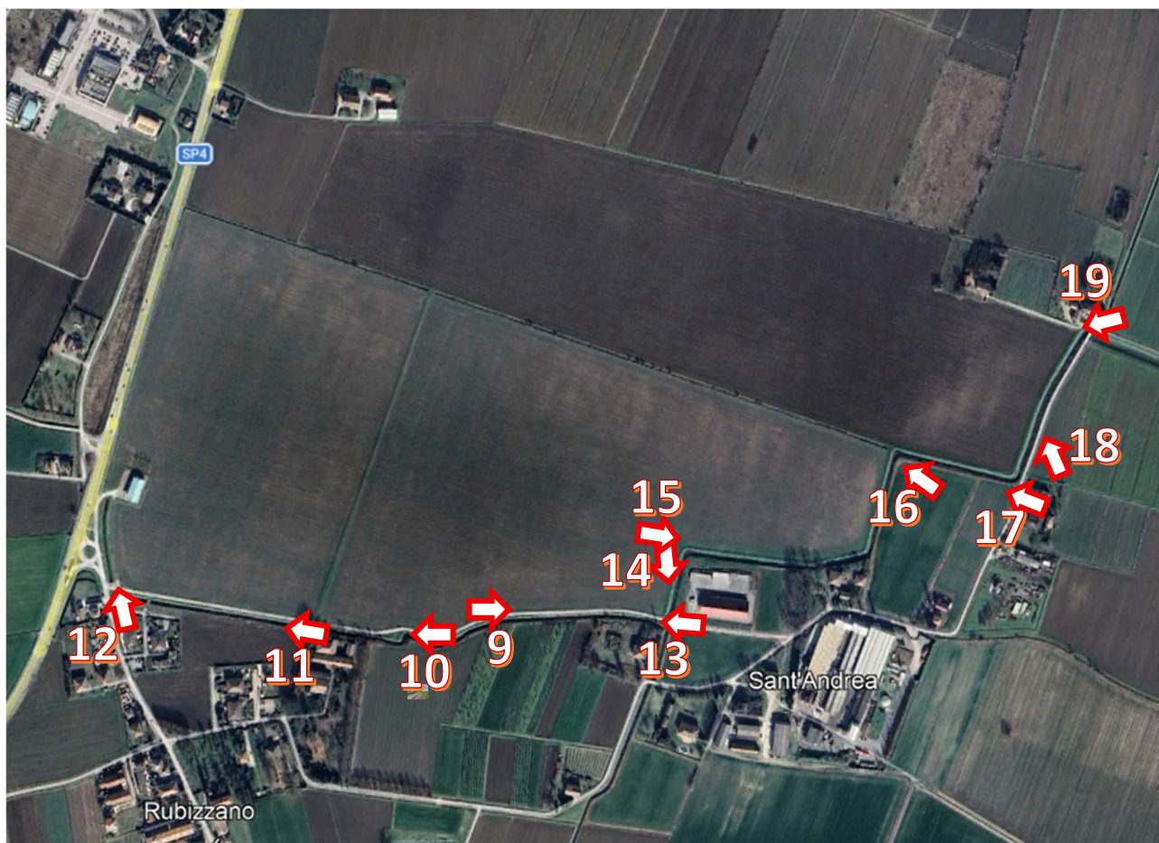
Figura 2: Punti di presa su ortofoto – FOTO A TERRA