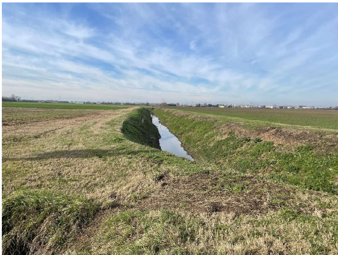
Foto 17 – Panoramica del lotto e del canale visti da Via Raveda in direzione Ovest